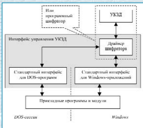
Рис.2. Интерфейс управления УКЗД.