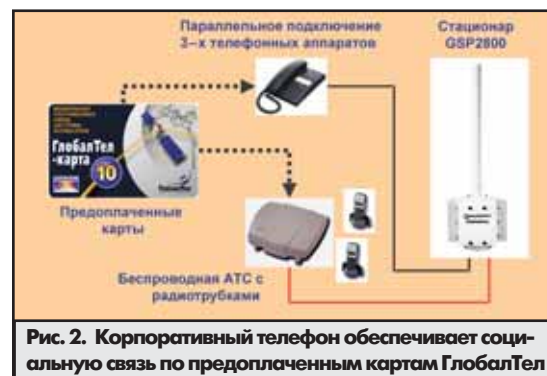
Рис. 2. Корпоративный телефон обеспечивает социальную связь по предоплаченным картам ГлобалТел

РАЗДЕЛЕНИЕ ТРАФИКА на корпоративный и персональный, обеспечиваемое предоплаченными телефонными картами ГлобалТел, позволяет сотрудникам компании использовать корпоративные терминалы Глобалстар как для служебной, так и для личной, социальной связи по коду доступа 771 с русско- или англоязычным меню. Например, морской терминал GSP2800M используется на судне для производственной телефонии, доступа в базу данных компа-