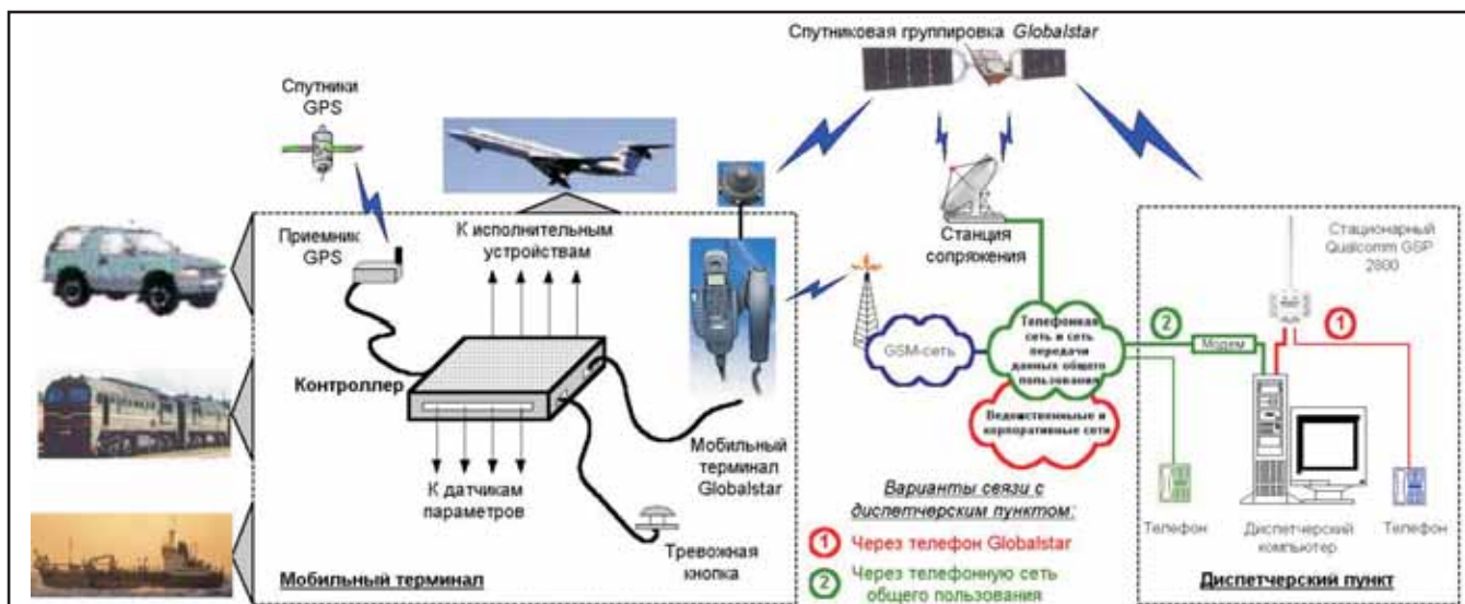
Рис. 4. Типовая схема корпоративной диспетчерской сети на базе АТ Глобалстар

ЗАО "ГлобалТел" Тел.: (095 или 501) 797-27-27, 797-26-24, 797-27-24 Факс: (095 или 501) 797-26-27, 797-27-31 Москва, 123104, Сытинский пер., 3/25, стр. 5 custcare@globaltel.ru www.globaltel.ru