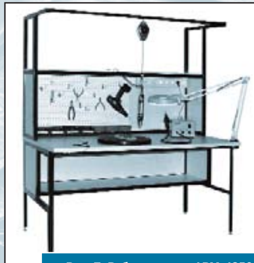
Рис. 7. Рабочее место АРМ-4350

В 2000 г. появилась идея предлагать не только контрольно-измерительные приборы, но и паяльное оборудование АКТАКОМ. Уже через год эта продукция была оценена потребителем и стала пользоваться большой популярностью. Чуть позже мы организовали производство лабораторной мебели. Вначале это были всего 3 модели рабочих