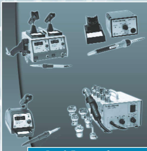
Рис. 6. Паяльное оборудование АКТАКОМ

В настоящее время коллектив компании полон энергии и с оптимизмом и энтузиазмом смотрит в будущее. "ЭЛИКС" растет и развивается. Мы уверены, что и в дальнейшем отечественные потребители смогут получать от нас самую современную, самую качественную измерительную технику.