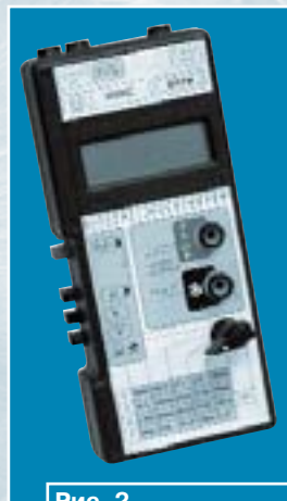
Рис. 2. Ручной цифровой мультиметр ЭЛИКС-2018

Активно проводя выставочную деятельность, мы заметили, что на рынке измерительной техники крайне не хватает информации о новых приборах - как об импортных, так и об отечественных. Именно это послужило основой для создания журнала "Контрольно-измерительные приборы и системы" (КИ-ПИС). Занимаясь поставкой и разработкой приборов в области радиотехнических измерений, мы ста-