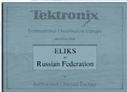
Рис. 4. Свидетельство официально-дистрибьютора Tektronix

1996 г мы начали сотрудничать с мировыми брендами Tektronix, Hitachi, FLUKE. Получив статус официального дистрибьютора Tektronix в России, мы одними из первых смогли предлагать серьезную измерительную технику, хорошо известную российским потребителям своей надежностью и широкими возможностями. В 1999 г, после проведения всестороннего изучения специалистами Tektronix нашей сервисной и метрологической служб, мы стали единственным в России авторизованным сервис-центром этой компании.