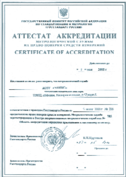
Рис. 5. Аттестат аккредитации на право поверки