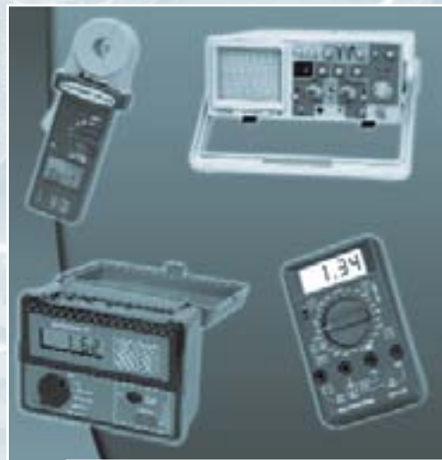
Рис. 8. Измерительное оборудование АКТАКОМ

В настоящее время компания "ЭЛИКС" предлагает более 2000 наименований различных приборов известных мировых производителей: АКТАКОМ, Fluke, Gage, Hitachi, Tektronix. Развивается собственное производство измерительной техники модельного ряда АКТАКОМ®, лабораторной мебели, радиомонтажного оборудования. Все наши приборы разработаны